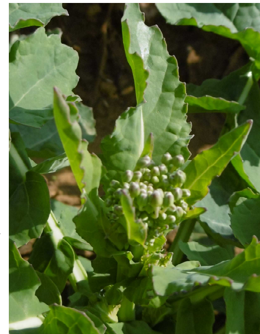
Bild 1: Raps am Standort Obercorn ist nun im Knospenstadium, BBCH 51 = Hauptinfloreszenz inmitten der obersten Blätter von oben sichtbar

Die Wettervorhersage ist momentan etwas kryptisch. Jedenfalls war heute kurzzeitig in der Minette-Region Zuflug der Rapsschädlinge festzustellen. Statt Stängelrüssler finden sich immer mehr Rapsglanzkäfer. An der Mosel und im Minette und in Teilen des Gutlandes, wo der Raps ins Knospenstadium geht (BBCH 50 ff, Bild 1 ) sollte an solchen Tagen mit einer ersten Klopffprobe begonnen werden. Basierend auf der Wettervorhersage vom 07. März ( www.agrimeteo.lu ) sind die Meteo-Bedingungen für einen Zuflug von Stängelrüsslern und Glanzkäfern in einzelnen Landesteilen gegeben (siehe Karte).