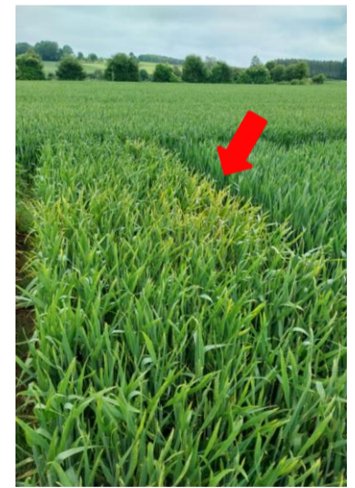
Abbildung 3: Gelbrost hat nesterweise die oberen Blättern im Winterweizen erreicht.

Die Wintertriticale am Standort Bettendorf befindet sich in der Entwicklungsphase der Fruchtbildung. Die Pflanzen reifen jetzt ab, was mit einem Absterben der Blätter einhergeht. Fungizideinsatz ist zu diesem späten Zeitpunkt der pflanzlichen Entwicklung nicht mehr sinnvoll und auch nicht mehr zugelassen.