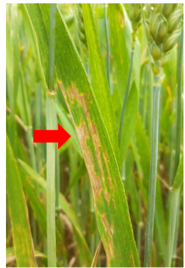
Abbildung 1: Septoria-Blattdürre auf den oberen Blättern eines ungeschützten Winterweizenbestandes.

Am Versuchsstandort Wilwerdange im Norden beginnt der Winterweizen zu blühen und es wurde Gelbrost gefunden, der nesterweise bereits die oberen Blättern erreicht hat (Abb. 3). Winterweizenbestände im Ösling, die bislang nicht behandelt wurden oder bei denen die Fungizidbehandlung mehr als 2 Wochen zurück liegt, sind gefährdet, weil in letzterem Fall die Wirkdauer des Fungizides abläuft. Winterweizenbestände, die bislang nicht behandelt wurden oder bei denen die Fungizidbehandlung mehr als 2 Wochen zurück liegt, sollten auf Befall mit Gelbrost kontrolliert werden. Wenn 30% der Pflanzen auf den oberen 3 Blättern Symptome von Gelbrost aufweisen, ist eine Spritzung anzuraten.