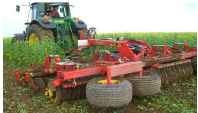
Abbildung 2: Einige Hersteller bieten bereits spezialisierte Geräte zur Zwischenfruchtzerstörung und -einarbeitung an. Hier: Kombination aus Messerwalze und Kurzscheibenegge.

Zur Zerstörung der Zwischenfrüchte kann zwischen zwei Methoden unterschieden werden: klimatisch (Frost bei abfrierenden Zwischenfrüchten) und mechanisch (Flug, Mulchen, Walzen, Grubber, Scheibenegge). Jede dieser Methoden hat ihre Stärken und Schwächen im Hinblick auf Kostenaufwand (Arbeitszeit, Mechanisierung) und Umweltschutz. Zudem lassen sich verschiedene Techniken kombinieren um eine effiziente Zwischenfruchtabtötung zu gewährleisten. Bei den Bearbeitungsgängen muss ein besonderes Augenmerk auf die Befahrbarkeit der Flächen gelegt werden um mögliche Verdichtungsschäden zu vermeiden. Bei der Einarbeitung sollte ein flaches Einmischen (Scheibenegge) und kein tieferes