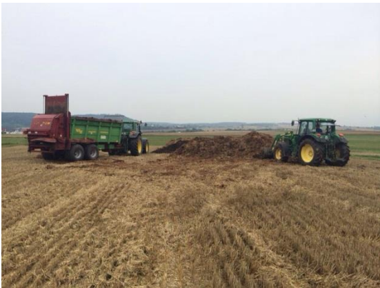
Abbildung 1: Die Mistausbringung zu Mais sollte nach der Getreideernte und vor der Zwischenfrucht erfolgen

Zwischenfrüchte bringen sowohl für den Boden als auch für den Landwirt viele Vorteile mit sich. Sie bilden einen Erosionsschutz, lockern intensive oder enge Fruchtfolgen auf und verbessern die Humusbilanz der Böden. Zudem verhindern sie die Auswaschung von Nährstoffen, indem sie die Nährstoffe im Boden für ihr Wachstum nutzen und für die Folgekultur wieder zur Verfügung stellen. Viehhaltende Betriebe können ihren organischen Dünger beim Zwischenfruchtanbau sinnvoll und effizient einsetzen. Vor allem Festmist eignet sich als Dünger vor der Zwischenfruchtaussaat. Im Gegensatz zur Gülle ist bei Mist ein weit größerer Teil des Stickstoffs organisch gebunden (ca. 85 %). Die Freisetzung erfolgt daher über einen längeren Zeitraum.