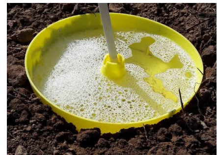
Bild 1: Gelbschale im Boden eingelassen, um das Auftreten des Rapserrdflohs zu erfassen. Auf dem Bild fehlt aber noch die Gitterauflage!

Kurz nach der Saat sollten auch die Gelbschalen im Raps aufgestellt werden. Gelbschalen sind im Agrarhandel oder auch im Internet erhältlich ( Bild 1 ). Postieren Sie 4 - 6 Schalen verteilt im Bestand etwa 10 Meter vom Feldrand entfernt. Am besten eignen sich immer die Ecken eines Feldes, weil man dort am besten „ran kommt“. Zur Erfassung des Rapserrdflohes sollte die Schale bis zum Rand in den Boden eingegraben werden, da auf diese Weise dieser spezielle Käfer besser erfasst wird. Füllen Sie die Schalen etwa zur Hälfte mit Wasser, und fügen Sie ein paar Tropfen Seife hinzu. Die Seife bewirkt, dass die Schädlinge in das Wasser einsinken können. Vergessen Sie bitte nicht die Gitter-Auflage auf die Schale zu legen. Das Gitter ist so grobmaschig, dass es die Schädlinge durchlässt, aber so feinmaschig, dass es die Nutzinsekten ausschließt.