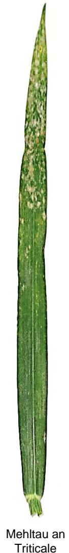
Mehltau an Triticale

Die Liste aktuell zugelassener Pflanzenschutzmittel finden Sie unter https://saturn.etat.lu/tapes/tapes_de.htm . Beachten Sie bei Spritzungen die Produkthinweise und die Angaben auf dem Etikett, insbesondere einen ausreichenden Abstand zu Gewässern, das Tragen einer angemessenen Schutzkleidung zum Erhalt der eigenen Gesundheit und die maximal erlaubte Anzahl von Anwendungen mit dem jeweiligen Mittel pro Jahr. Eine Hilfestellung zum sicheren Umgang mit Pflanzenschutzmitteln aus Anwendersicht finden Sie im Bauere Kalender aus dem Jahr 2015 ab Seite 85. Für Empfehlungen zu konkreten Fungizidmischungen beachten Sie bitte die Hinweise der Landwirtschaftskammer.