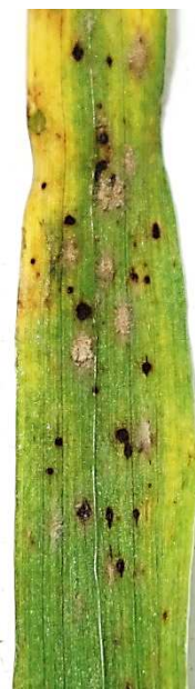
Aktuelles Befallsbild an Wintergerste im Süden.

Die Liste aktuell zugelassener Pflanzenschutzmittel finden Sie unter https://saturn.etat.lu/tapes/tapes_de.htm . Beachten Sie bei Spritzungen die Produkthinweise und die Angaben auf dem Etikett, insbesondere einen ausreichenden Abstand zu Gewässern, das Tragen einer angemessenen Schutzkleidung zum Erhalt der eigenen Gesundheit und die maximal erlaubte Anzahl von Anwendungen mit dem jeweiligen Mittel pro Jahr. Eine Hilfestellung zum sicheren Umgang mit Pflanzenschutzmitteln aus Anwendersicht finden Sie im Bauere Kalender aus dem Jahr 2015 ab Seite 85. Für Empfehlungen zu konkreten Fungizidmischungen beachten Sie bitte die Hinweise der Landwirtschaftskammer.