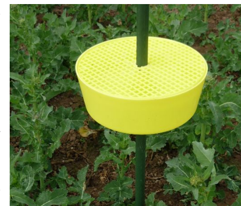
Gelbschale mit Gitterauflage im Rapsfeld.

Die Prognose für die Zuwanderung der Stängelrüssler in die Rapsschläge der einzelnen Kantone ist in der links stehenden Karte für die Periode 27. Februar bis 1. März angegeben. Zusammenfassend lässt sich festhalten, dass die vorhergesagten Wetterbedingungen derzeit keine Zuwanderung der Rapsschädlinge erlauben. Der Bekämpfungsrichtwert (10 Individuen pro Schale in 3 Tagen) wird nicht erreicht werden. Applikationen zur Bekämpfung der Rapsschädlinge sind derzeit also nicht erforderlich.