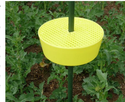
Gelbschale mit Gitterauflage im Rapsfeld.

Die Prognose für die Zuwanderung der Stängelrüssler in die Rapsschläge der einzelnen Kantone ist in der links stehenden Karte für die Periode 23. - 27. Februar angegeben. Zusammenfassend lässt sich festhalten, dass die vorhergesagten Wetterbedingungen derzeit keine Zuwanderung der Rapsschädlinge erlauben. Die momentan vorhergesagte leichte Wetteraufbesserung für das Wochenende (Sonntag) genügt von den Temperaturen nicht. Der Bekämpfungsrichtwert (10 Individuen pro Schale in 3 Tagen) wird nicht erreicht werden. Applikationen zur Bekämpfung der Rapsschädlinge sind derzeit also nicht erforderlich.